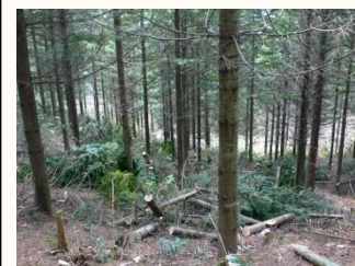
間伐され明るく健全な森林へ